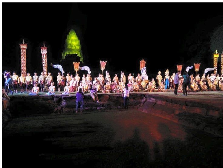
A gálaműsor szereplői háttérben zöld fénnel megvilágítva a Phimai templom főépülete.