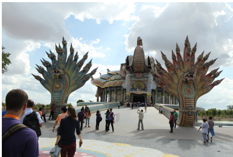
Wat Non Kum elefánt alakú buddhista szentély