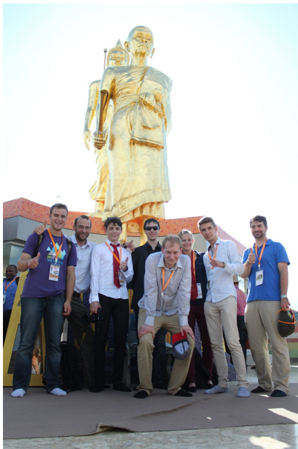
A magyar csapat az elefánt szentély tetején