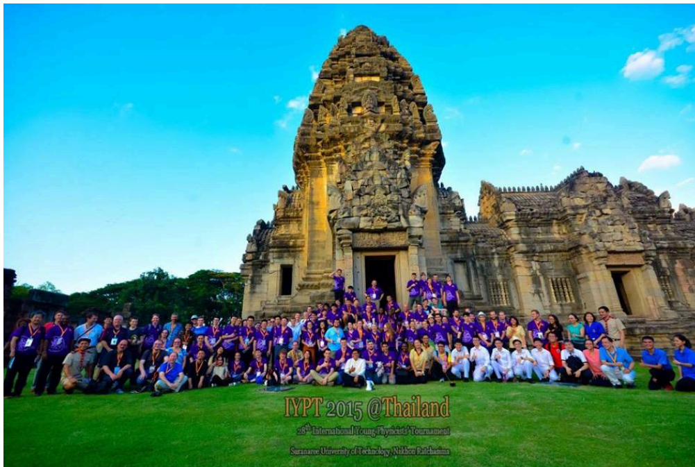
A 27. IYPT verseny résztvevői a Phimai Történelmi Parkban

szerepelt mind a kutatásaik tudományos színvonala, az igényesen előkészített prezentációk, az angol szaknyelv rutinszerű használata, a vitakézség és a csapatmunka terén is.