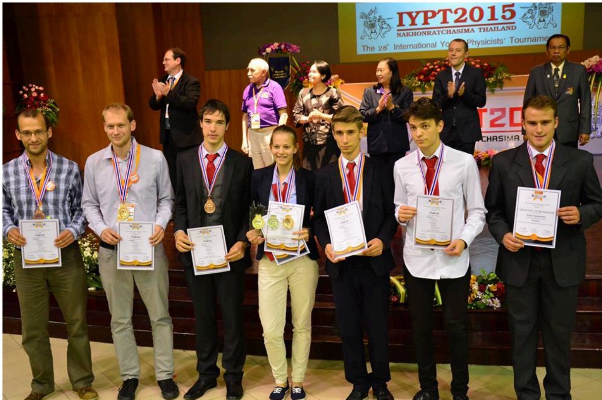
A legjobb bronzérmes csapat.

Az idén 28. alkalommal megrendezett Ifjú Fizikusok Nemzetközi Versenyén (eredetileg: International Young Physicists' Tournament, röviden: IYPT) a magyar csapat a legjobb bronzérmes helyezést érte el a thaiföldi Nakhon Ratchasima-ban 2015. június 27. és július 4. között rendezett versenyen. Az egész éves felkészülés sikeres lezárása mellett, a remek szervezésnek köszönhetően sikerült belekóstolni a thaiföldi kultúrába és hétköznapiakba is.